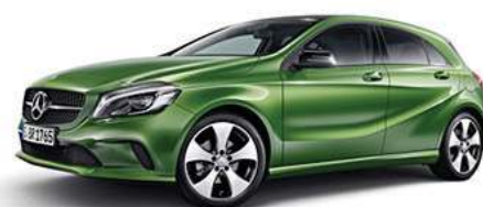
CLASSE A 250 4MATIC