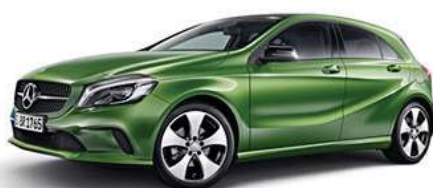
CLASSE A 200